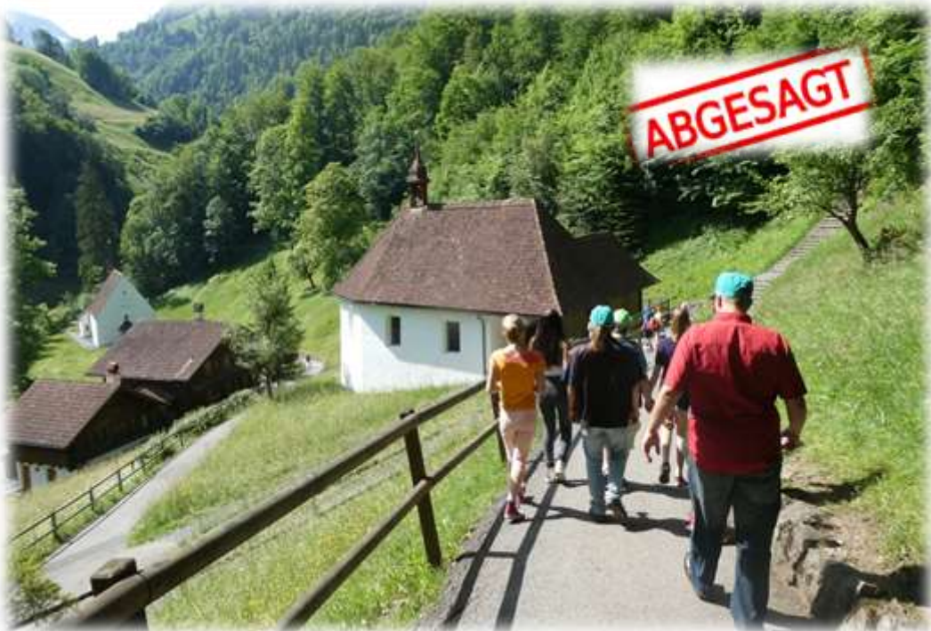
Erinnerungen an den Flüeli-Kurs 2019.