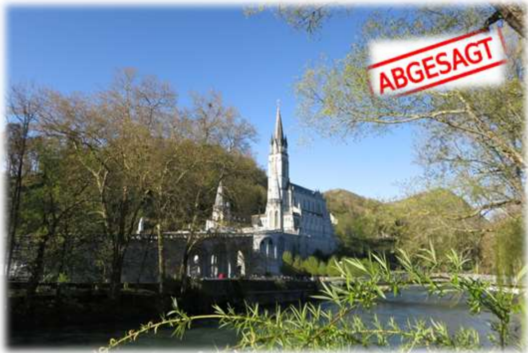
Die Maria-Empfängnis-Basilika in Lourdes.