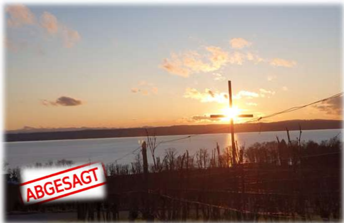
Rebberg neben dem Schloss Hersberg in Immenstaad.