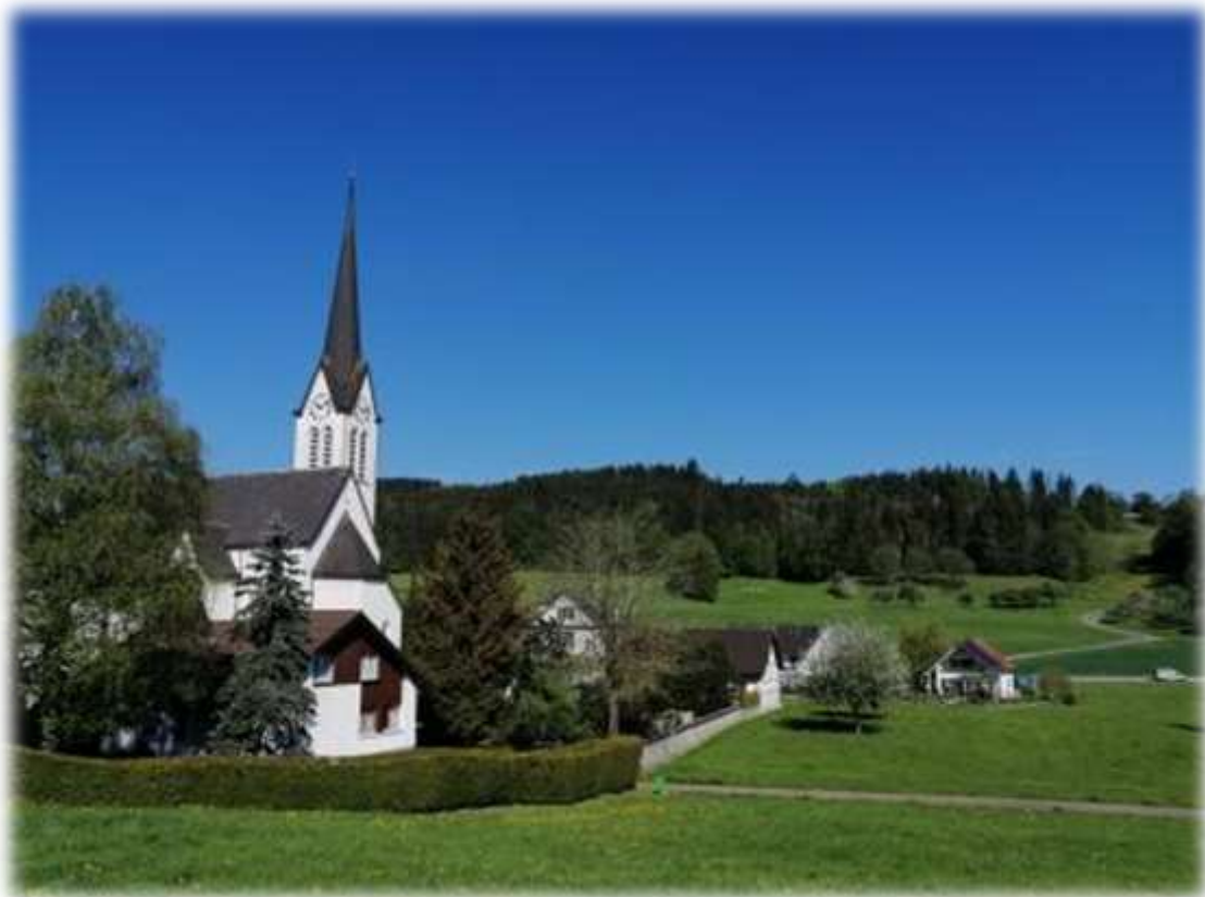
Kirche St. Martin, Wuppenau