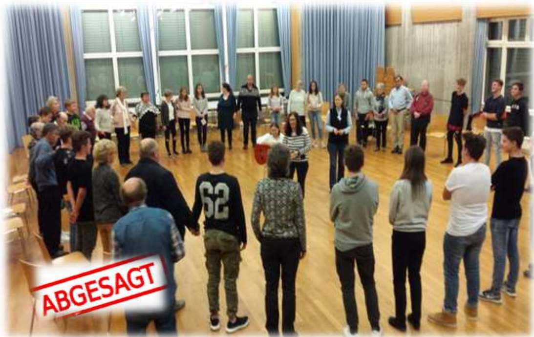
Erinnerungen an die Begegnung mit der Arboner Jugend 2018.